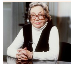
1) Photomaton de Marguerite Duras, 1940 2) Marguerite Duras en 1984 à Paris, émission Apostrophes

En partenariat avec : Association internationale Marguerite Duras (Conseillère littéraire : Joëlle Pagès-Pindon) Bibliothèque municipale de Tours Centre national du Livre Cinémathèque Cinéma Studio Conseil départemental d'Indre-et-Loire Crédit mutuel DRAC Centre-Val de Loire CICLIC La Boîte à livres Le Petit Faucheux Mairie de Tours Région Centre-Val de Loire