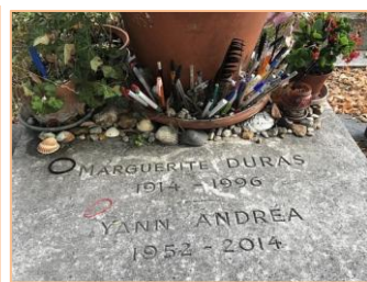
Illustrations : 1) Signature de Marguerite Duras sur la dédicace de son ouvrage Le Marin de Gibraltar à Jean-Paul Sartre, 1952 - - 2) Marguerite Duras en 1960. Photo d'identité - 3) Marguerite Duras 4) Cimetière du Montparnasse, 2018